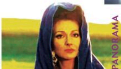
pagina 44 Medea PASOLINI 100

In copertina: Lamb di Valdimar Jóhannsson Islanda/Polonia/Svezia 2021